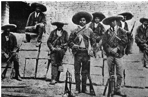
Сельская жандармерия «руралес» – гроза мексиканских крестьян

ной покупки оставшихся двух третей. 11 Эти компании, среди учредителей которых было немало государственных чиновников нового режима (и по совместительству представителей иностранных фирм), активно взялись за дело. Вот только искали они землю в основном в индейских деревнях. Крестьяне, как правило, не имели никаких документов на землю, так как их предки обрабатывали ее еще до прихода испанцев. Они знали только то, что их земля лежит, например, от того дерева до этого камня. Компании немедленно объявляли эти земли, на которые часто уже имелся солидный покупатель, иностранец или местный помещик, «ничейными» и продавали их заинтересованным лицам. Неграмотным крестьянам предлагали обращаться в суд, неизменно принимавший решения не в их пользу.