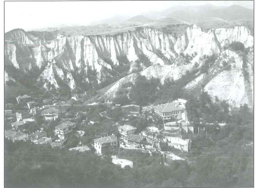
Рис. 1. Мелник. Общий вид

Во время раскопок в максимальной степени изучены его фортификация, культовое (религиозное) и жилищное строительство, городское благоустройство, экономическое, духовное и культурное развитие с IV—III вв. до Р.Х. по начало XX в., когда в результате