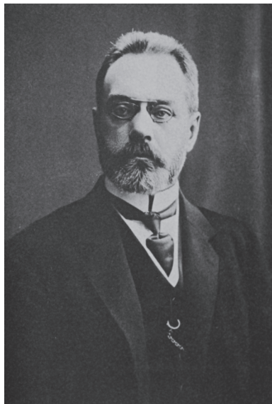
А. И. Гучков

Печать, наряду с парламентом, оставалась главным инструментом партий (особое значение по своей оперативности и информированности в этом смысле, конечно, имела печать кадетская) и по мере обострения ситуации все более и более втягивалась в конфликт. Тотальное использование печати в политической борьбе отмечал сам Столыпин, когда признавался А. П. Извольскому: «У нас прессы нет, а то, что есть, кривое зеркало» 15 . Как вспоминал уже в советское время один из журналистов, «в период 1910–1914 гг., несмотря на господство реакционных тенденций, с прессой бороться стало несоизмеримо трудно» 16 .