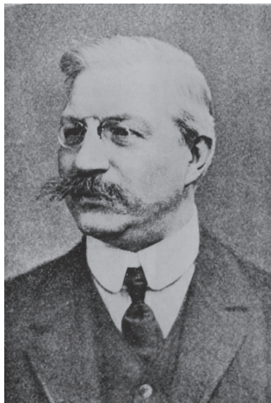
П. Н. Миллюков

верждал: «Мы хотим НЕ РАСШИРЕНИЯ ПРАВ, А РАВНОПРАВИЯ [так в тексте — Ф. Г.]. Наше дело теперь: не портить будущего» 47 .