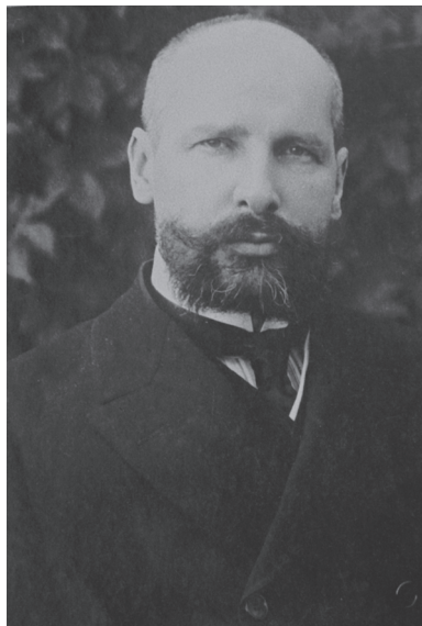
П. А. Столыпин

системный и управляемый характер. Это могло привести к политическому «успокоению» (стабилизации) и дать возможность осуществлять реформы. Во-вторых, предполагались масштабные социально-экономические мероприятия (аграрная реформа, социальное обеспечение рабочих, развитие народного образования), обеспечивающие перспективу дальнейшего развития России. Создание новой системы местного суда и самоуправления должно было способствовать этому процессу, закрепить его результаты. Развитие России обеспечивало ей сохранение статуса великой державы на международной арене. Однако решение этой задачи было связано также и с повышением обороноспособности (проведением военной и военно-морской программ).