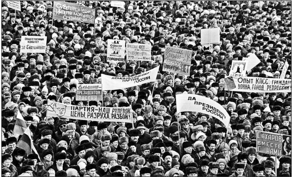
Митинг в Екатеринбурге. 1991 год.

Съезде народных депутатов РСФСР, где произошла знаменитая сцена между Горбачевым и Ельциным, который фактически требовал от президента СССР подписать указ о роспуске КПСС и всячески демонстрировал ему полноту власти, приобретенную после провала ГКЧП. «Невеликодушно унижать спасенного президента (...) Мы-то должны сообразить, что перебивать его, кричать, задавать издевательские вопросы недостойно российских депутатов! Это не демократия — это просто плохое воспитание». В статье упоминается также о закрытии коммунистических газет и некоторых других неоднозначных решениях: «Конечно, всё это можно считать издержками победы. Люди устали за семьдесят четыре